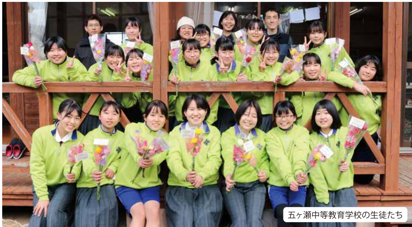
五ヶ瀬中等教育学校の生徒たち