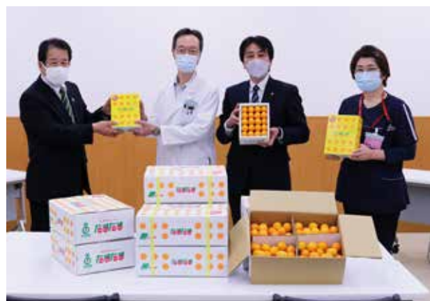
▲高千穂町立病院の医療従事者へ贈呈