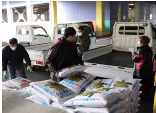
▲生産者のトラックに肥料を積み込む職員ら

生産者の生産コスト低減を目的に、JA高千穂地区は2月14、15、17日の3日間、各資材店舗で肥料の即売会を行いました。今回は、総数約370件6190袋の予約申込がありました。主に水稲用肥料が対象で、少しでも生産コストを抑えようと事前予約をしていた生産者は自己取りに訪れました。各資材店舗は朝から続々とトラックが集まり、職員がトラックに肥料を積み込んでいました。今後も出来る限り安価で予約購買、自己取り販売を計画します。ご理解・ご協力をお願いします。