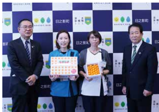
▲日之影町立病院の医療従事者へ贈呈