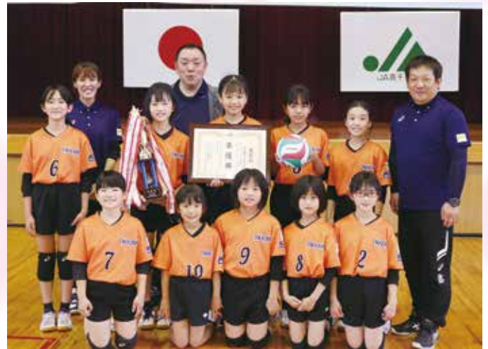
準優勝 高千穂サンライズ