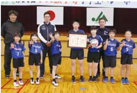
3位 日之影ファイターズ