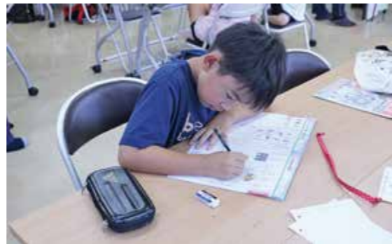
▲熱心に夏休みの宿題に取り組む児童

J A女性部助け合い組織たんぽぽ会が協力して取り組む、第2回地域・子ども食堂まんまるカフェが7月27日に高千穂町社会福祉協議会で行われました。今回は学習支援ボランティアの方が夏休み中の子どもたちの学習支援を行ったり、サロンのお年寄りたちとの交流もあつたりと、カレーを食べながら賑やかな声が響いていました。