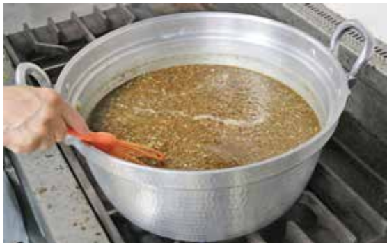
▲焼肉のタレを作っているようす

J A女性部高千穂支部は、乾しいたけを使った玉ねぎドレッシングと焼肉のタレ作り講習会を7月21日に行いました。乾しいたけを使った加工品作りに挑戦したいという意見があり、入れるしいたけの形状、分量など試作品作りから試行錯誤して取り組んでいました。目指すは商品化。楽しみな取り組みがまたひとつ増えました。