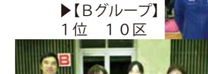
▶【Bグループ】 1位 10区