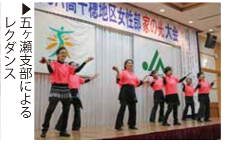
▶五ヶ瀬支部によるレクダンス