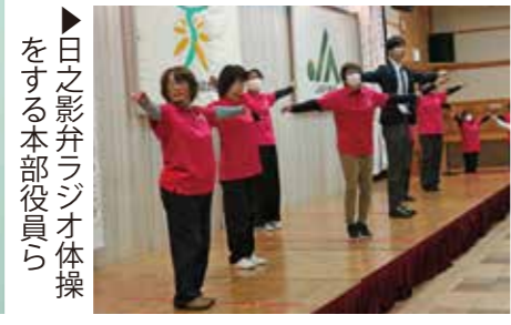
▶日之影弁ラジオ体操をする本部役員ら