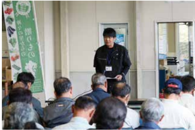
▲販売実績について説明する職員

出荷数量:524t(92%) 【10月末】 販売金額:158,244,935円(116%) 単 価:302円(126%) ※()前年比