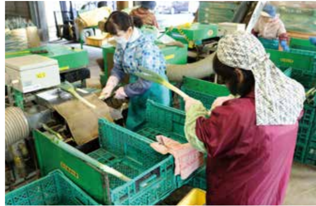
▲選果場での出荷作業の様子

白ネギの出荷が10月17日に始まり、上野の選果場にはネギの香りが漂っていました。現在管内では7戸の農家が白ネギを栽培しており、出荷は12月頃までを予定しています。今年度は販売数量27ト、販売金額945万円を目標としています。当地区の白ネギは主に宮崎や鹿児島に出荷され、高品質で食味が良く市場からの信頼も高くなっています。