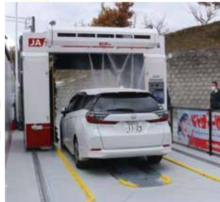
▲西臼杵で初めて設置されたドライブスルー洗車機