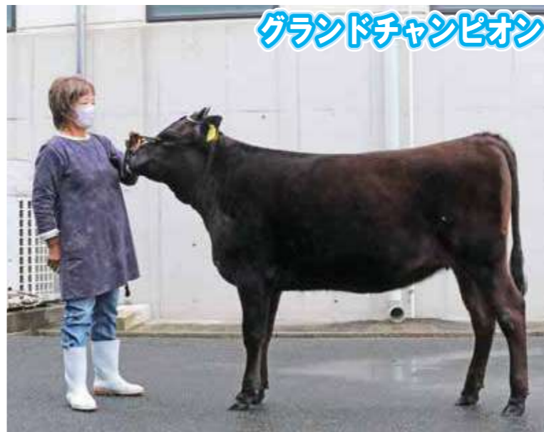
グランドチャンピオン