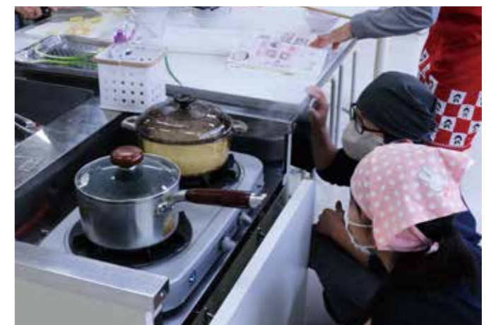
▲ご飯が炊き上がるのをじっくり観察する児童ら