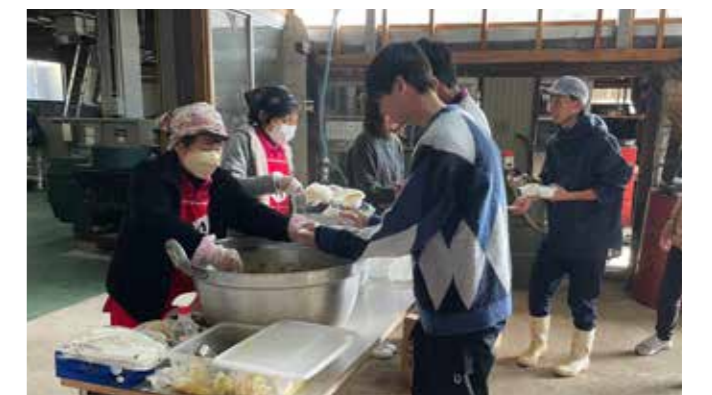
▲女性部特製カレーにお代わりの列をつくる生徒ら

昼食には J A 女性部特製の高千穂牛カレーが提供され、生徒たちは生産者や地元スタッフとの会話を楽しんでいました。その後は、高千穂峡の観光や神楽鑑賞を行い、西白杵地域を満喫できたようでした。