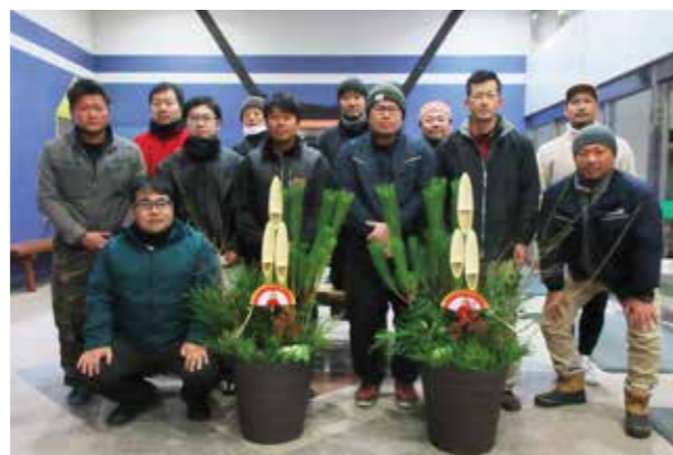
▲参加した青年部盟友。いつでも盟友募集中!!

新年を迎えるにあたって、12月20日に J A 青年部が門松作りを行いました。毎年恒例となった門松作り。参加した盟友たちは、寒い中手慣れた様子で作業し、立派な門松が完成しました。作成した門松は、本所玄関前と本所資材に置かれました。