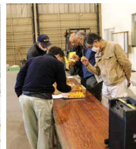
▲1月11日 出荷目揃え会のようす