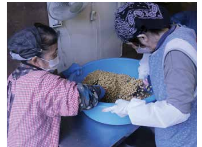
▲蒸した大豆を冷やす作業をする女性部員

手作りの大豆や米麹を持参するなど、今年も各家庭思い思いの自信作が出来ました。毎年参加する会員も多く、手作りみそでないと食べられないと話します。旨味たっぷり愛情たっぷりの手作りみそ。食べるのが楽しみですね。