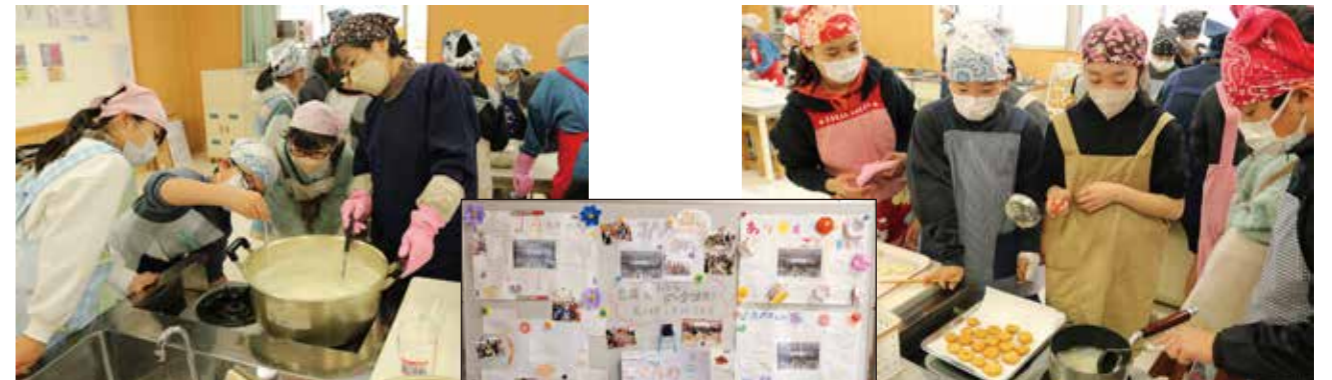
◀児童からの感謝のお便り

高千穂小学校の5年生は、『食農フェスティバル』と題して2月15日に豆腐とおからドーナツを作りました。これまで児童たちが種蒔きから収穫・脱穀と大豆づくりに取り組み、集大成となる今回の調理実習。JA高千穂地区女性部5名が参加し豆腐の作り方の指導を行いました。初めての作業に最初は戸惑っていた児童たちも、生の大豆の香りやおからの手触りを感じ、おからドーナツを作る工程では笑顔で楽しみながら取り組む様子がみられました。ドーナツには農家手作りのきな粉をまぶし、会食では女性部員との交流会となりました。後日、児童たちから女性部へ写真が添えられた感謝の手紙が届きました。