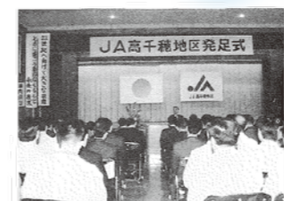
平成6年4月1日 高千穂地区 農業協同組合発足