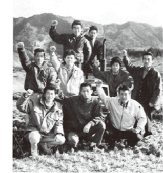
広報誌かるめご創刊号