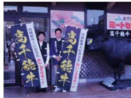
JAミートセンターにて