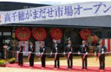
平成22年4月24日 JA高千穂地区ミートセンター・ 高千穂牛レストラン和オープン