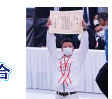
令和4年10月6日 第12回全国和牛能力共進会 （鹿児島全共） 第7区名誉賞受賞