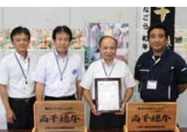
平成27年7月10日 高千穂牛地域団体商標登録