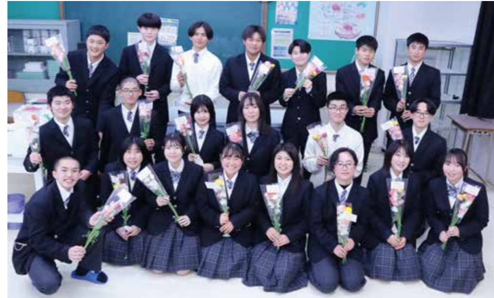
高千穂高等学校の生徒たち

高千穂地区花き園芸振興会は、2月28日に高千穂高等学校、3月1日に五ヶ瀬中等教育学校で卒業生へ贈る花束作りを行いました。花束には当地区で生産されたラナンキュラスとスイートピーを使用し、生産者自ら花束作成の指導を行いました。五ヶ瀬中等教育学校(表紙)では中学1年生の女子生徒19名が43束を、高千穂高等学校では1・2年生22名が98束を作りました。在校生は丁寧にラッピングしメッセージカードを添え、出来上がった花束には先輩方への感謝の気持ちが込められていました。花束は、翌日の卒業式で卒業生に贈られました。