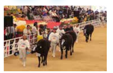
平成19年10月11日 第9回全国和牛能力共進会 （鳥取全共） 第4区名誉賞受賞