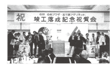
平成13年5月7日 ゆめゆめプラザ落成