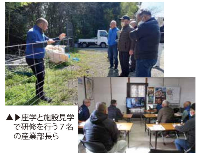
座学と施設見学で研修を行う7名の産業部長ら