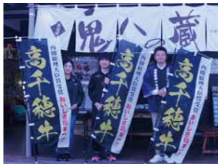
がまだせ市場鬼八の蔵にて