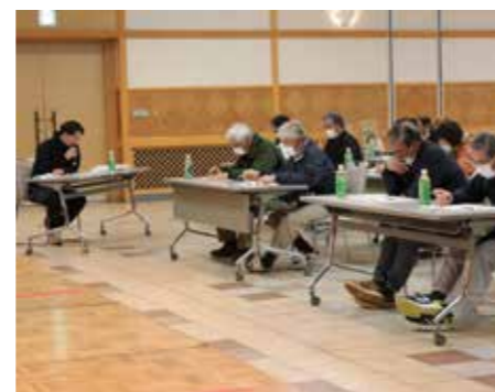
▲トマト栽培研修会の様子