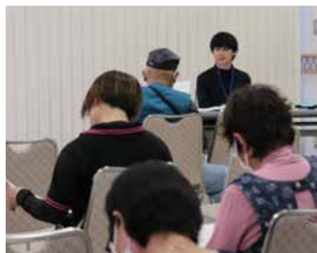
▲ピーマン栽培研修会の様子