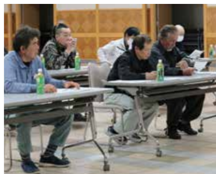
▲きゅうり栽培研修会の様子