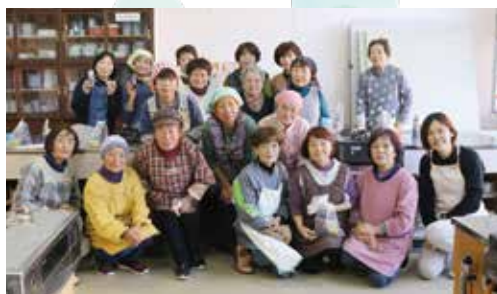
-12月2日中央公民館にて