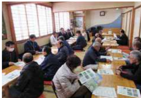
▲実績検討会のような様子

販売数量:57t(134%) 【11月末】 販売金額:56,506,118円(127%) 単 価:993円(95%) ※()前年比