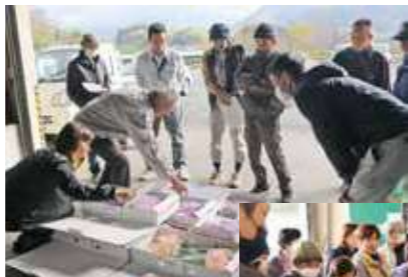
◀スイートピーの目揃会のような様子

本格的な出荷に向けて、生しいたけとスイートピーの出荷説明会・目揃会が11月27日に田口野集出荷場で行われました。参加した生産者は出荷要領や規格を確認し、目揃会では写真を撮るなどしながら出荷の統一を図りました。