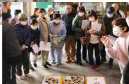
▶生しいたけの目揃会のような様子