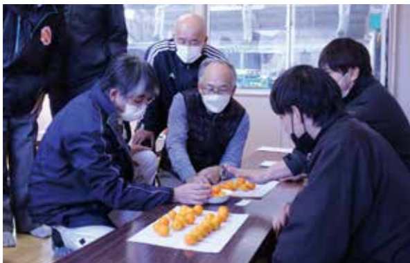
▲サイズや色の付き具合などを確認する生産者ら

【全体運】交友関係が活発化。懐かしい友達との再会も心を潤します。おしゃれに力を入れると開運へ。外出が吉。 【健康運】室内でのちょっとしたけがに気を付けて 【幸運の食べ物】縮み小松菜