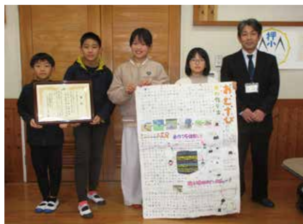
▲JA賞を受賞した押方小学校5年生のグループ

みやざきの食と農を考える県民会議西臼杵支部による令和6年度『食と農』壁新聞コンクールが行われました。管内の小学校より26点が出品され、優秀作品5点に賞が贈られました。どの作品も、児童らが日々の学習から学んだことや農への興味が見事にまとめられており審査員を悩ませる出来栄でした。受賞結果は下記のとおりです。