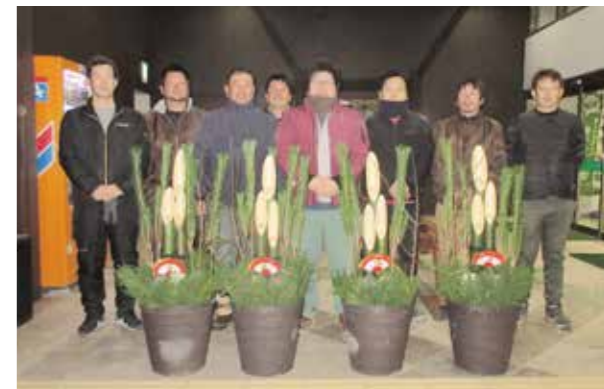
いつでも盟友募集中!

JA青年部は12月23日に門松作りを行いました。参加した盟友たちは例年通り手慣れた様子で作業し、立派な門松が完成しました。作成した門松は高千穂支店玄関前と高千穂資材に飾られました。