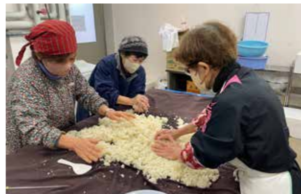
一緒にみそ作りせんけ?

JA女性部の食育部会は、1月8日に麴作りを行いました。部会長の「作ってみらん?」の一声から約10年ぶりに実現。出来上がった米麴を用い次はみそを手作りするのが楽しみのようでした。