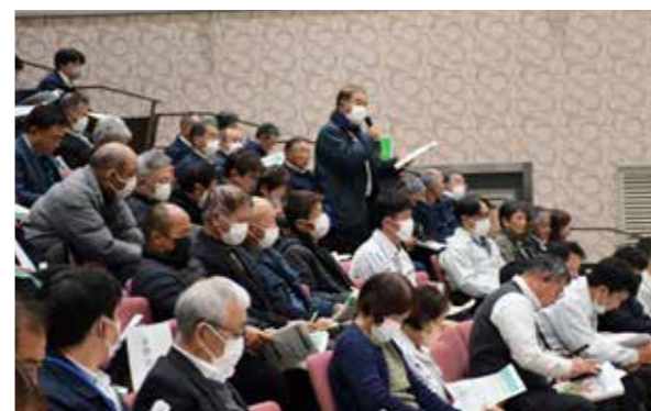
▲質問や意見を述べる組合員

組合員代表との意見交換会が12月25日にJA-AZMホールで行われました。合併後初となる中期計画の策定に向けて、組合員の意見を反映することが目的。JA理事と組合員代表者ら約170人が参加しました。参加した組合員からは、合併によるスケールメリット、現在の課題確認など様々な意見が出ました。価格転嫁に対しては、消費者へ農家の現状をしっかりと伝えてほしいといった要望が挙げられました。