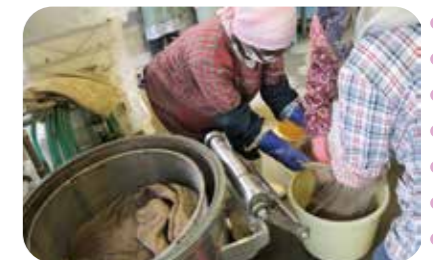
前日から浸水しておいた大豆を蒸し器に投入!