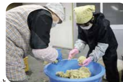
空気を抜いて容器に詰める

JA女性部恒例のみそ作りが、12月~2月にかけて行われています。今年も総勢112人が参加し、使用した大豆は800kg超。畑で育てた大豆や手作りの米麴を持参するなど、今年も各家庭それぞれのみそが出来ました。「この手作りみそでないと食べられない」と毎年参加する部員が多いようです。無添加で旨味たっぷり愛情たっぷりの手作りみそ、おいしさ間違いなしです。