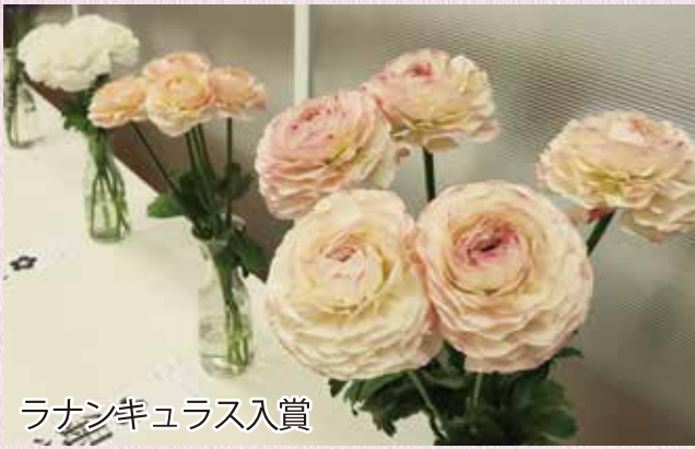
ラナンキュラス入賞