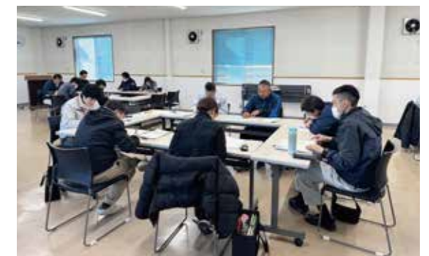
▲グループに別れて意見交換を行うようす

高千穂地区営農振興協議会の部会全体研修会が1月30日に西臼杵支庁で行われ、会員である営農指導員らが出席しました。中山間地域におけるスマート農業の活用事例についての講演のあと、グループに分かれて西臼杵のスマート農業や10年後の農業について意見交換会、また各部会の活動報告が行われました。