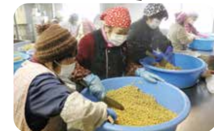
蒸した大豆を冷ます