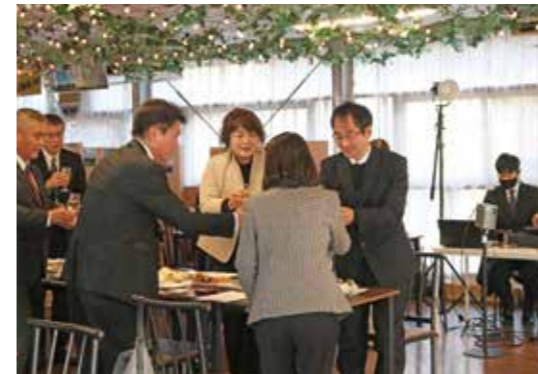
▲1/28五ヶ瀬ワイナリーで行われた祝賀会にて