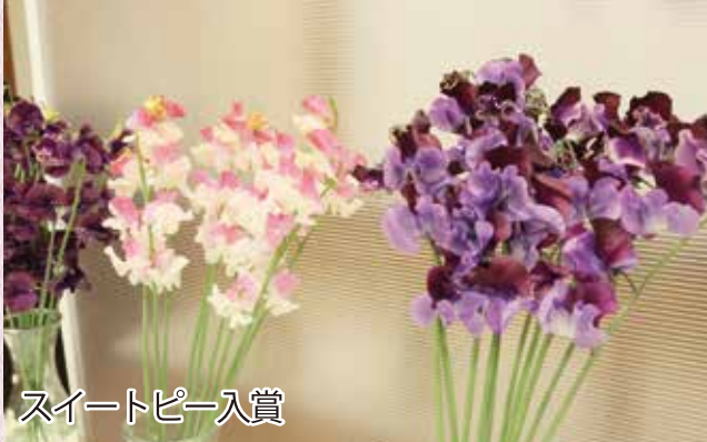
スイートピー入賞