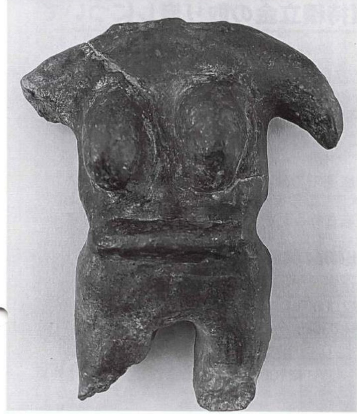
注：陣内遺跡出土の土偶のレプリカ、実物は県立博物館蔵、右腕のつけねと右足先端が欠損、豊満な乳房と腹部のふくらみは豊穡の証し、高さ(肩部まで)は12.5cmである。

古代人が豊穡を願い妊娠した女性を模した土偶をささげた... 宮崎県での出土例は極めて少ない