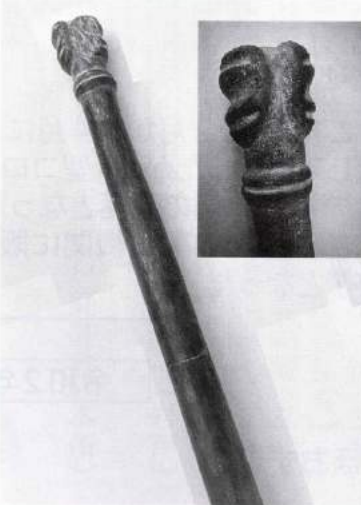
注：陣内遺跡発掘の石棒のレプリカ

神話の地の発掘とあってマスコミなどの注目を浴びたが、その中でも特異な発掘物の一つが石棒の発見であろう。