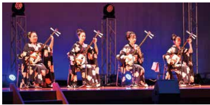
村上三絃道ステージ