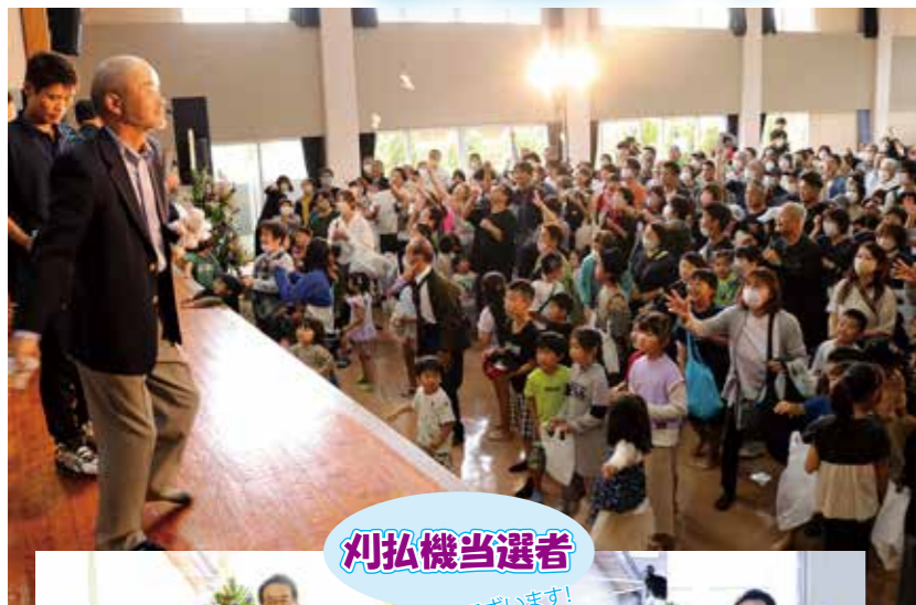
刈払機当選者 おめでとうございます!