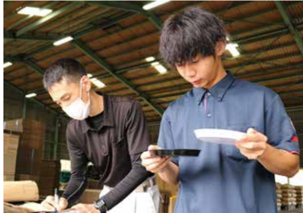
▲真剣な目で検査する検査員

普通期米の収穫に伴い、9月26日より戸の口集荷場で玄米検査が始まりました。検査は、検査員が玄米の水分量や粒張、未熟米や被害の混入具合を目視や補助器具を使用して確認し、等級を判別していきます。高千穂米ブランド確立のために、公正・厳格な検査に務めます。