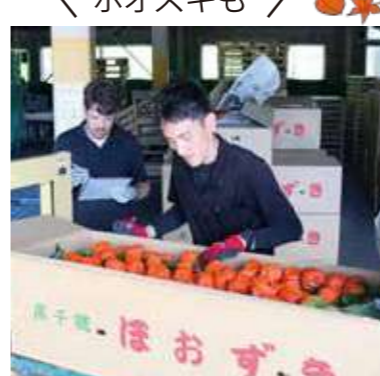
▲トマト出荷目揃え会のようす