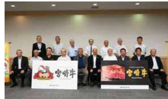
▲各地区本部の繁殖牛部会長と役員ら

県内各地区本部の繁殖牛部会長らでつくる繁殖牛部会長会が設立され、6月25日に宮崎市で開かれた初会合に約50名が出席しました。農業経費の増大による所得率の低下に加え、和牛枝肉価格の伸び悩みや子牛価格の下落など厳しい状況にある和牛経営において、今後各地区本部の代表が情報交換しながら生産性向上や購買誘致活動に取り組むこととしています。