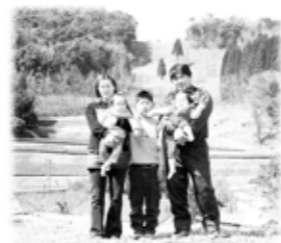
かるめご2004年4月号表紙

桜さんご家族が表紙を飾ってから20年。お母さんに抱っこされていた桜さんは素敵な農業女子になりました！