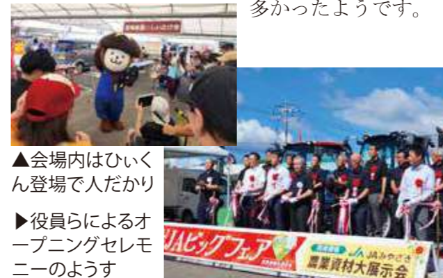
▲会場内はひいくん登場で人だかり

2024JAビッグフェアが7月5・6日の2日間、イオンモール宮崎で開催され最新の農業機械をはじめ、農業資材、生活資材などの展示販売が行われました。高千穂地区からも多くの組合員が参加し、会場では宮崎県産しいたけ市もありました。高千穂直販による旬の農産物販売に、キッチンカーの出店やみやざき犬のひいくんも登場するなど家族連れも多かったようです。