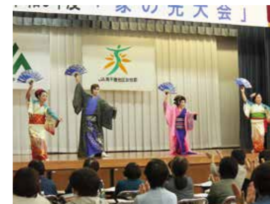
▲五ヶ瀬地区の踊り