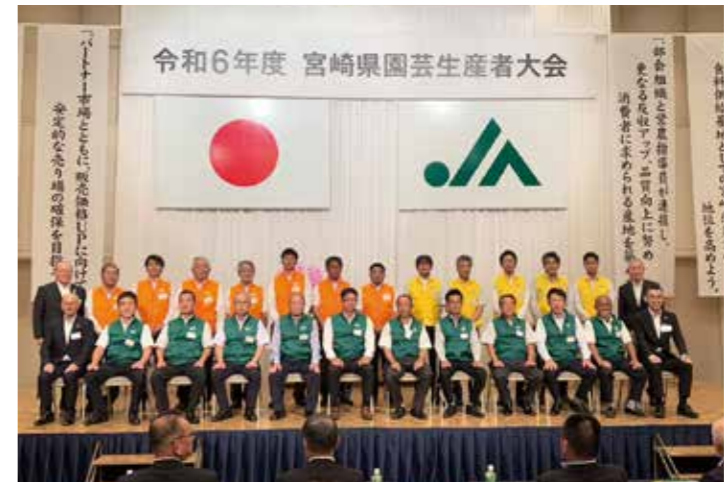
▲県域品目部会の部会長ら

JA宮崎経済連主催による宮崎県園芸生産者大会が、10月8日に宮崎市で開催されました。取引市場や県、生産部会代表者ら約250名が参加。本県農業の振興、農業所得の向上、さらに地域の活性化に向け、生産者や関係者が心を一つに今後の園芸事業の意思結集を図りました。