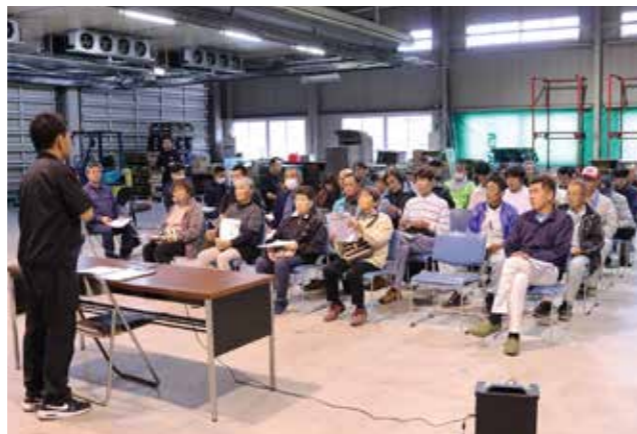
▲実績検討会に参加する生産者ら