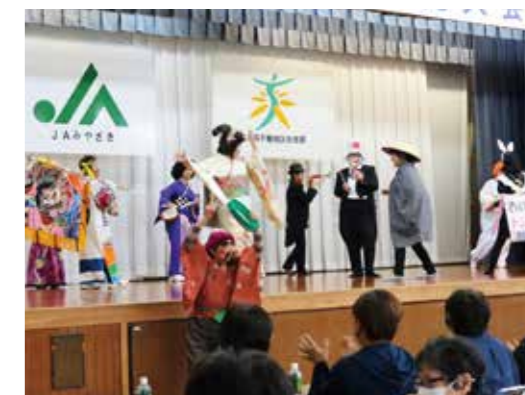
▲高千穂地区のおもとちんどん