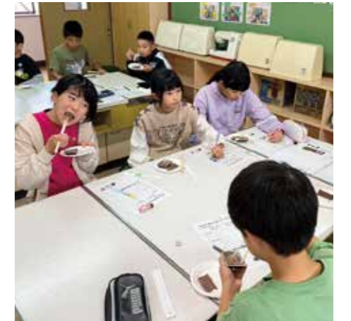
▲田原小学校で試食をする児童ら