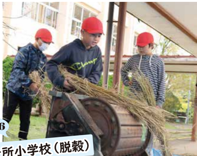
三ヶ所小学校(脱穀)